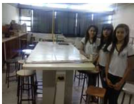
Figura 4: Trabalhos confeccionados utilizando princípios da Robótica Livre