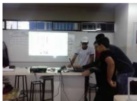
Figura 3: Alunos apresentando os trabalhos