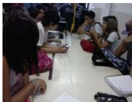
Figura 2: Alunos discutindo e planejando suas atividades

contasse com todo o procedimento adotado por eles na execução e finalização dos trabalhos.